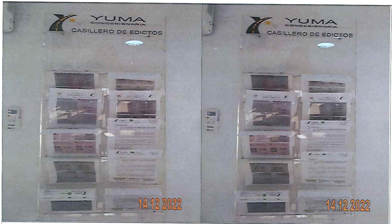
EDICTO DE LA R_35988 YC-CRT-121708